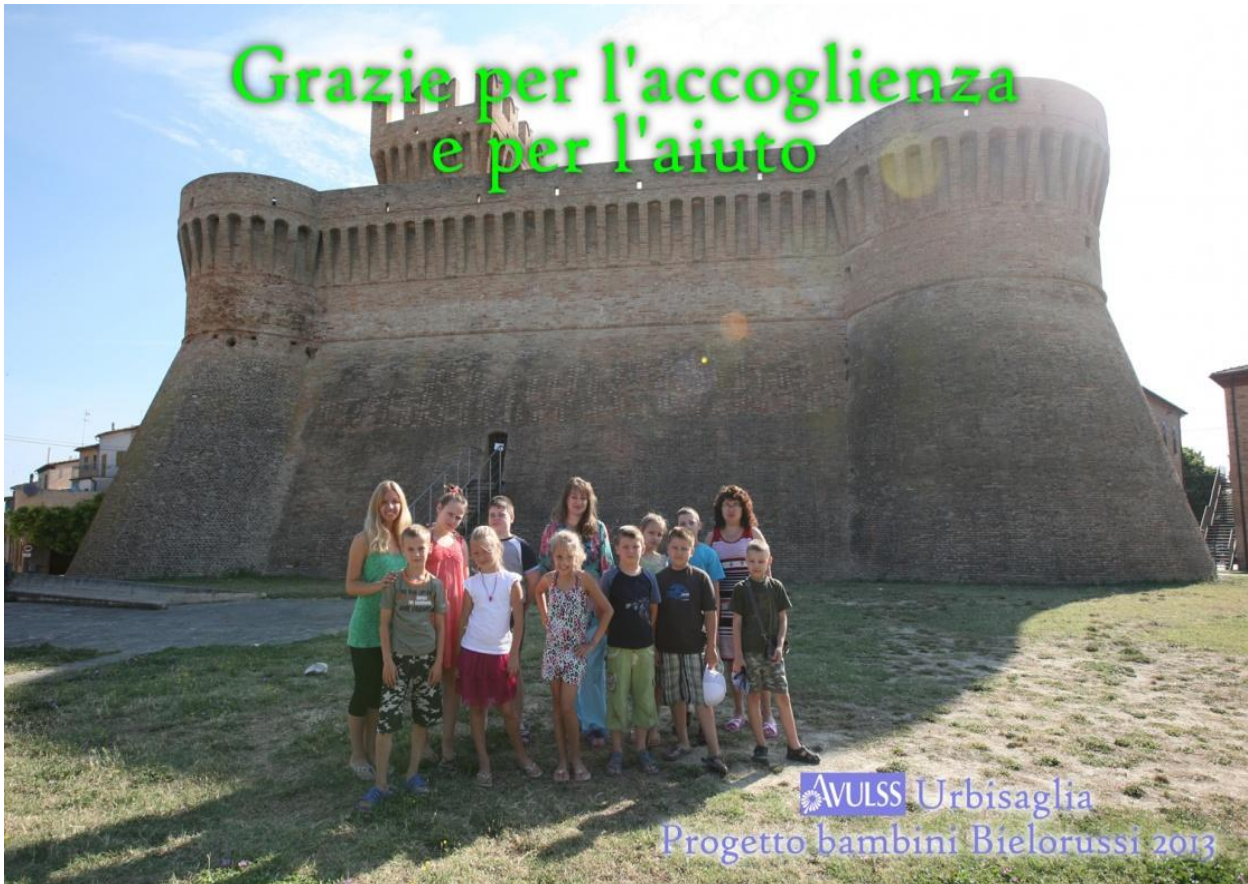
Progetto accoglienza 'Bambini Bielorussi'