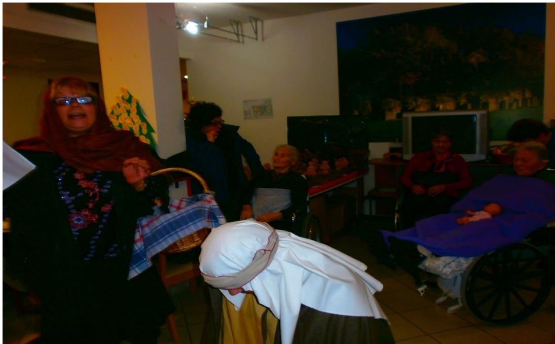
Recital ‘La vecchina del Presepe’