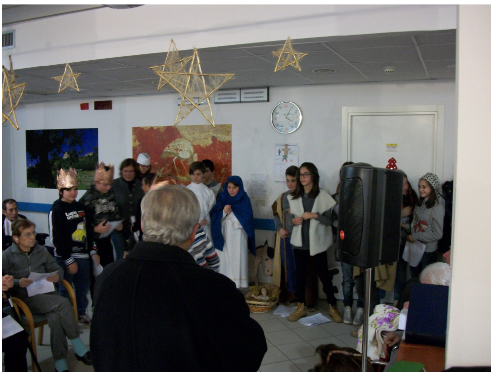
Recita di Natale

Abbiamo coinvolto in questo un gruppo di ragazzi del catechismo di 2° media che sono stati contenti di poter fare a Natale questo gesto così buono per i nonni della casa di riposo che hanno molto apprezzato questo momento di animazione.