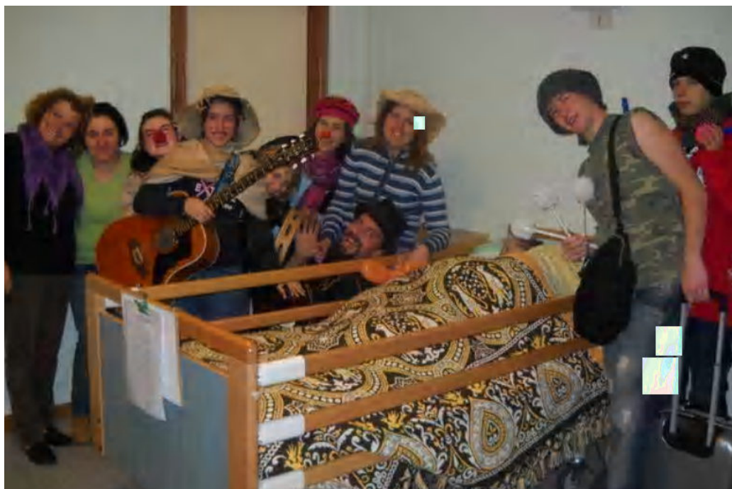
Foto del Corso Base Giovani tenutosi nel 2009