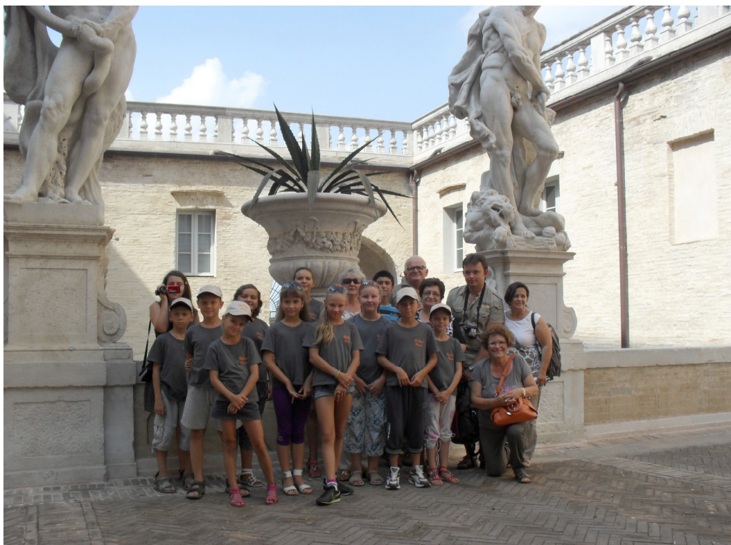
Bambini Bielorussi in visita a Macerata

Prima della loro partenza organizziamo una cena in piazza con tutta la popolazione per salutarli e questo è un bel momento di festa molto emozionante.